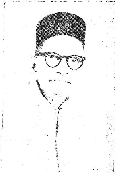
पं० अम्बिकाप्रसाद वाजपेयी